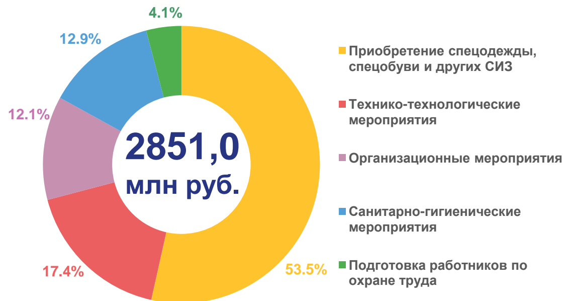
Израсходовано организациями на мероприятия по охране труда